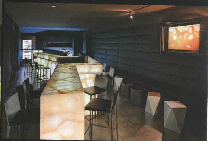
Ze zdi shlíží na bar Dvojitá Mona Lisa od Andyho Warhola