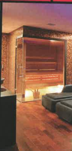
Vstupní chodba wellness centra, vpravo se soškou Henryho Moora